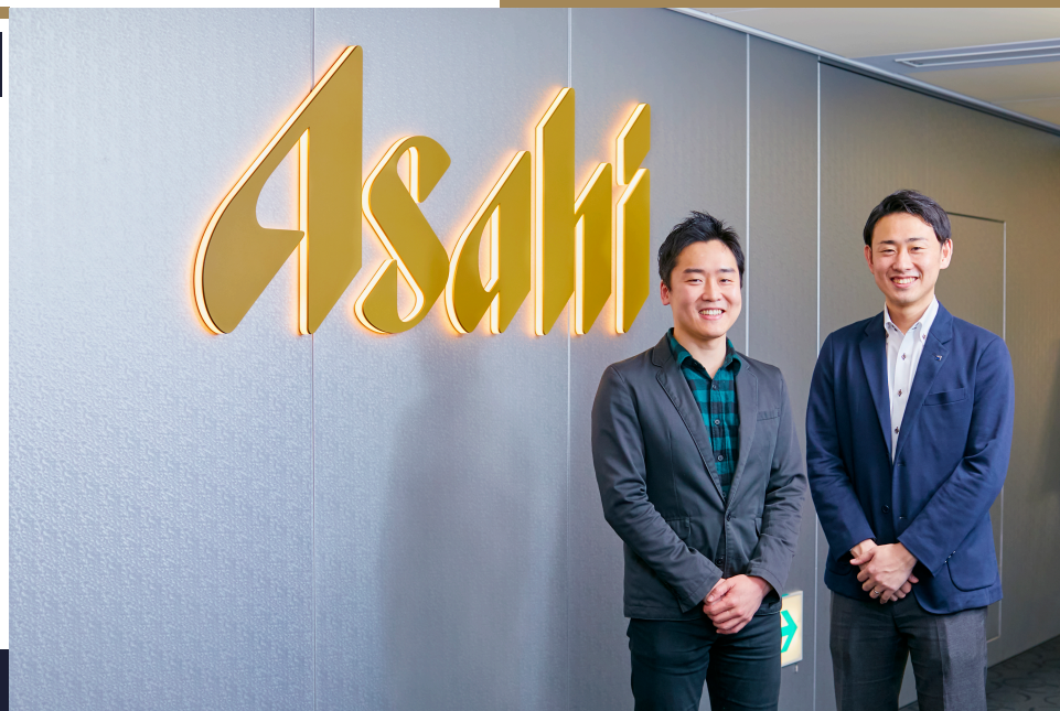
(左から：堀内様・木下様)

（吸収分割を行ったアサヒビール株式会社が、2011年7月1日商号変更を行い、純粋持株会社のアサヒグループホールディングス株式会社になりました）